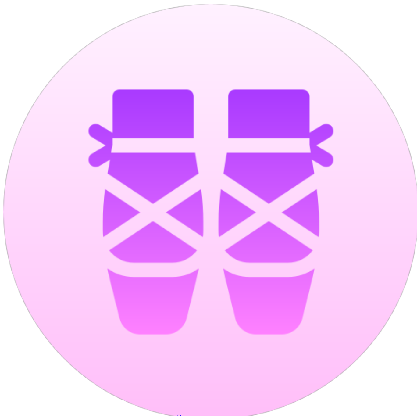
Ритмическая мозаика (5-7 лет)